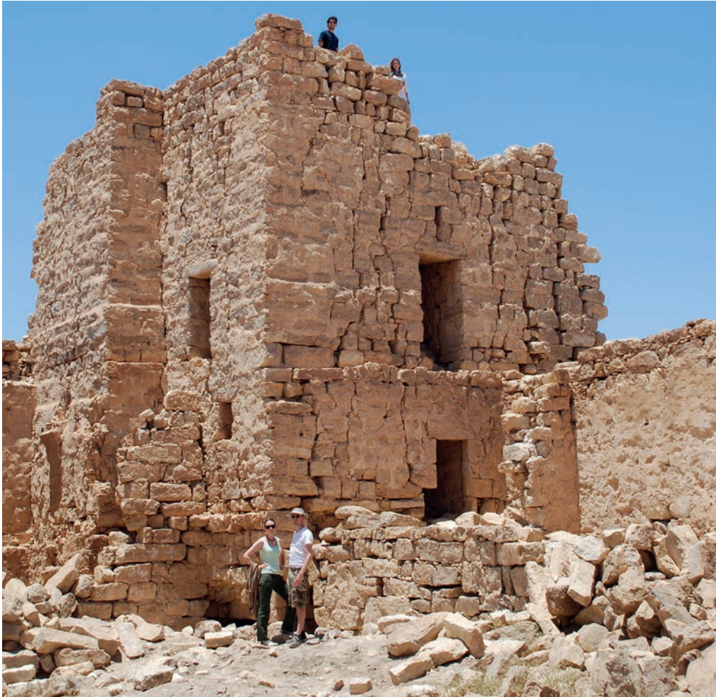
1. A corner tower at the fort of Qasr Bshir (Jordan)

Un tour d'angle du fort de Qasr Bshir (Jordanie)