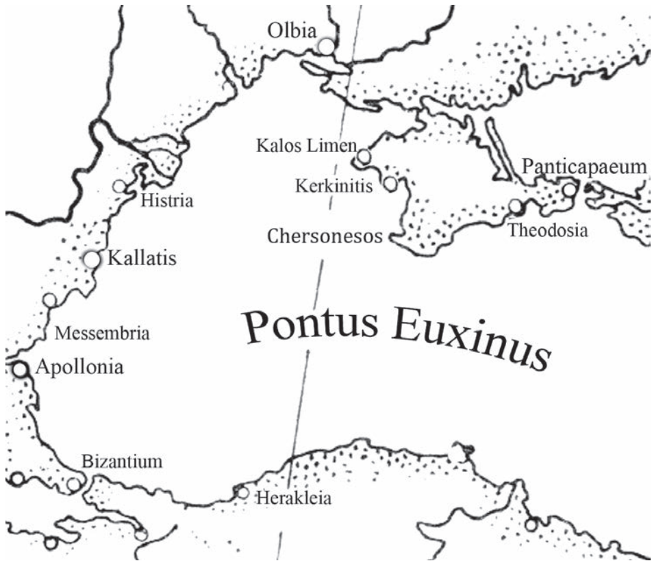
Map 1: Black Sea region in Ancient times.

campaigns of Pharnakes II. Then, the city became one of the Roman Empire's strongholds. The Roman garrison, formed of Moesian forces, was located here from the middle of the 2nd to the third quarter of the 3rd century. This fact allowed Chersonesos to improve its political and economic position, ultimately becoming a centre for the spreading of Roman politics and religion across the Tauric Peninsula.